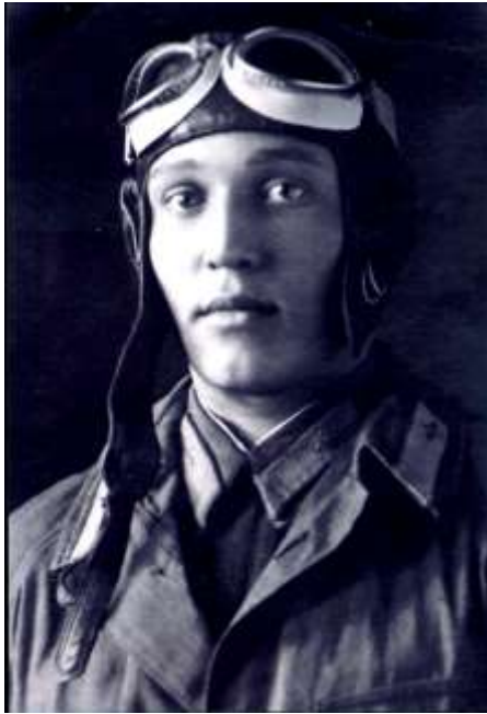
Фото Шурыгина В.А. 1942 г. Сычёвское Поле Памяти. 2009 г.