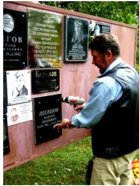
Родственники погибших героев устанавливают мемориальные таблички