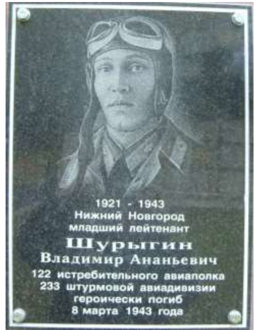
Мемориальная табличка Шурыгину В.А..