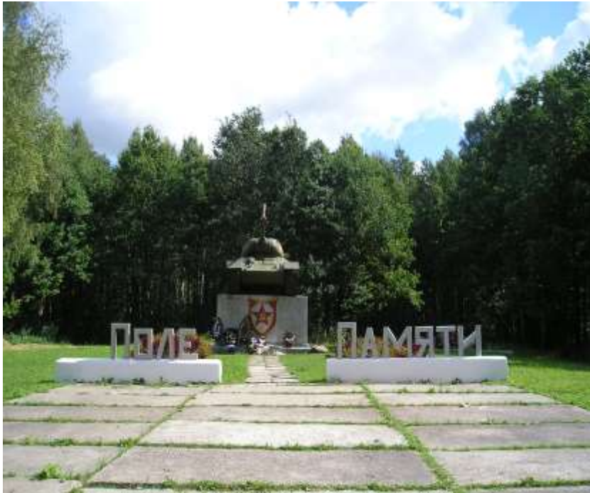
Сычѣвское Поле Памяти